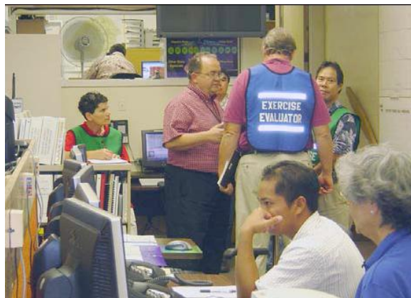
Ejercicio de Tsunami estilo Funcional realizado en el Centro de Operaciones de Emergencia – Defensa Civil del Estado de Hawái, circa 2003

El Estado de Hawái (EE.UU.) realiza anualmente dos ejercicios funcionales de tsunami tipo puesto de mando, usando escenarios locales y lejanos. El Centro de Alerta de Tsunami del Pacífico adapta los escenarios de tsunami para la Defensa Civil del Estado de Hawái, el organismo del estado que encabeza la coordinación en caso de desastre. Múltiples organismos gubernamentales federales, estatales, provinciales; organizaciones del sector privado y ONG prueban las comunicaciones de emergencia 24/7 y simulan la ejecución de la Respuesta de Emergencia de Tsunami –Procedimientos de Operación Estándar.