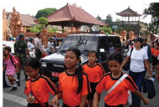
Niños de la escuela de Bali siguen una ruta de evacuación de tsunami como parte del simulacro de tsunami de Indonesia, Diciembre 2006

Se observó la participación en el simulacro de unos 1.000 a 2.000 estudiantes y profesores. El simulacro se realizó basándose en la recomendación de la Mesa Redonda sobre Tsunami en Indonesia de la COI en mayo de 2006. Desde entonces, se han efectuado anualmente en diciembre 26, simulacros similares en provincias de toda Indonesia.