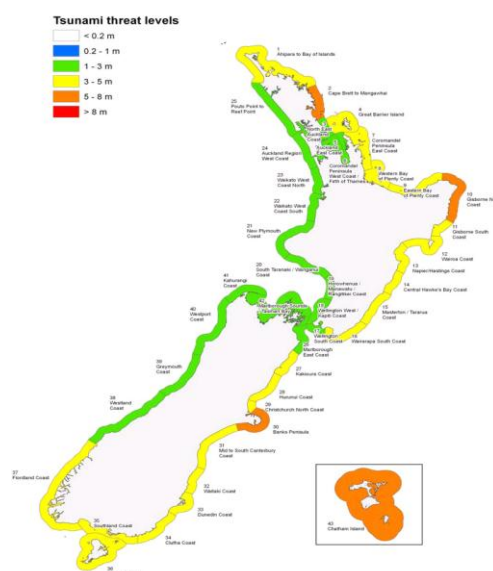
Ejercicio Tangaroa 2010 Mapa de Nivel de amenaza de tsunami: Los colores corresponden a la máxima elevación de agua esperada (es decir, cero a pico) en la zona costera

Durante el transcurso del ejercicio MCDEM continuó monitoreando y evaluando la situación, y emitió información adicional (incluyendo actualizaciones a la hora) según correspondiera. Se declaró teóricamente estado de emergencia nacional y se elaboró un plan de acción para apoyar la coordinación de la respuesta general. El ejercicio permitió probar los mapas de nivel de amenaza de tsunami recientemente elaborados que ilustran los impactos esperados. Se ejercitó la toma de decisiones y las notificaciones hasta la última etapa antes de poner en conocimiento a la población de Nueva Zelanda.