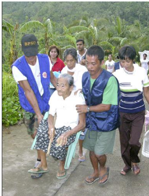
Foto: Una mujer mayor es transportada durante un Simulacro de Evacuación de Tsunami en una villa costera de Filipinas, mayo 2006

El Instituto de Vulcanología y Sismología de Filipinas (PHIVOLCS) realizó numerosas actividades de planificación de simulacro con funcionarios provinciales, que incluyeron desarrollo de planes de comunicación ante tsunami locales, toma de decisiones sobre las rutas de evacuación y la elaboración de mapas comunitarios. Observadores del Ejercicio apoyados por el PNUD y la COI participaron en el ejercicio.