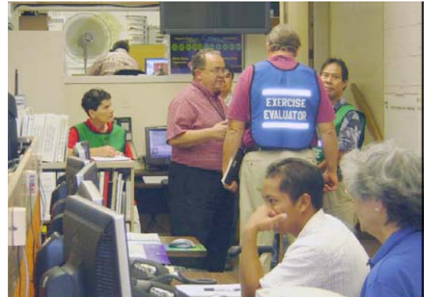
Ejercicio de Tsunami estilo Funcional realizado en el Centro de Operaciones de Emergencia – Defensa Civil del Estado de Hawai, circa 2003

El Estado de Hawai, EE.UU., realiza anualmente dos ejercicios funcionales de tsunami tipo puesto de mando, usando escenarios locales y lejanos. El Centro de Alerta de Tsunami del Pacífico adapta los escenarios de tsunami para la Defensa Civil del Estado de Hawai, el organismo del estado que encabeza la coordinación en caso de desastre. Múltiples organismos gubernamentales federales, estatales, provinciales; organizaciones del sector privado y ONG prueban las comunicaciones de emergencia 24/7 de Emergencia de Procedimientos de Operación Estándar.