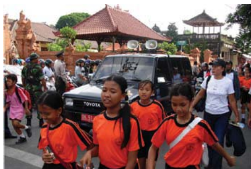
Niños de la escuela de Bali siguen una ruta de evacuación de tsunami como parte del simulacro de tsunami de Indonesia, Diciembre 2006

Se observó la participación en el simulacro de unos 1.000 a 2.000 estudiantes y profesores. El simulacro se realizó basándose en la recomendación de la Mesa Redonda sobre Tsunami en Indonesia de la COI en mayo de 2006. Desde entonces, se han efectuado anualmente en diciembre 26, simulacros similares en provincias de toda Indonesia.