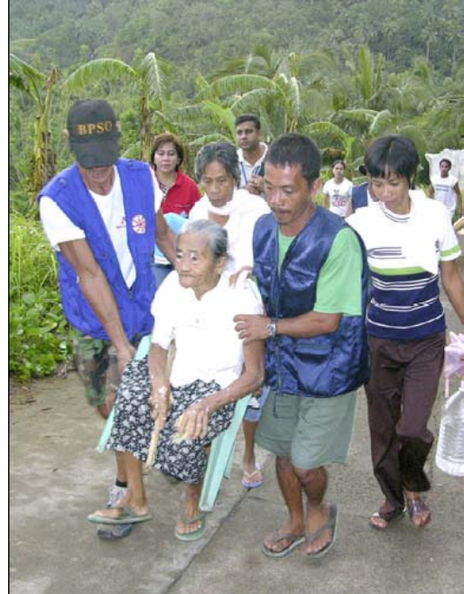
Foto: Una mujer mayor es transportada durante un Simulacro de Evacuación de Tsunami en una villa costera de Filipinas, Mayo 2006

El Instituto de Vulcanología y Sismología de Filipinas (PHIVOLCS) realizó numerosas actividades de planificación de simulacro con funcionarios provinciales, que incluyeron desarrollo de planes de comunicación ante tsunami locales, toma de decisiones sobre las rutas de evacuación y la elaboración de mapas comunitarios. Observadores del Ejercicio apoyados por UNDP y COI participaron en el ejercicio.