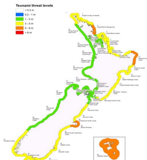
Ejercicio Tangaroa 2010 Mapa de Nivel de amenaza: de tsunami: Los colores corresponden a la máxima elevación de agua esperada (es decir, cero a pico) en la zona costera

Durante el transcurso del ejercicio MCDEM continuó monitoreando y evaluando la situación, y emitió información adicional (incluyendo actualizaciones a la hora) según correspondiera. Se declaró teóricamente estado de emergencia nacional y se elaboró un plan de acción para apoyar la coordinación de la respuesta general. El ejercicio permitió probar los mapas de nivel de amenaza de tsunami recientemente elaborados que ilustran los impactos esperados. Se ejercitó la toma de decisiones y las notificaciones hasta la última etapa antes de poner en conocimiento a la población de Nueva Zelanda.